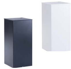
Theke / Counter Dekor L 990 x T/W 772 x H 1150 mm

Theke mit Aufsatz Anthrazit oder Weiß Counter with top anthracite or white